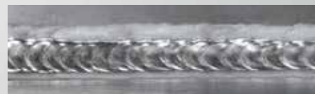
DUO Plus™ - Aluminium

Die Funktion verbessert die Überwachung des Schweißbades und verringert die Wärmezufuhr.