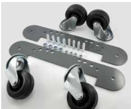
Radsatz zur Montage unter dem Schutzbügel (Artikel-Nr. 78861413)