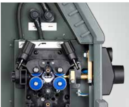
LED-Licht in der Drahtkonsole (Artikel-Nr. 78861545)