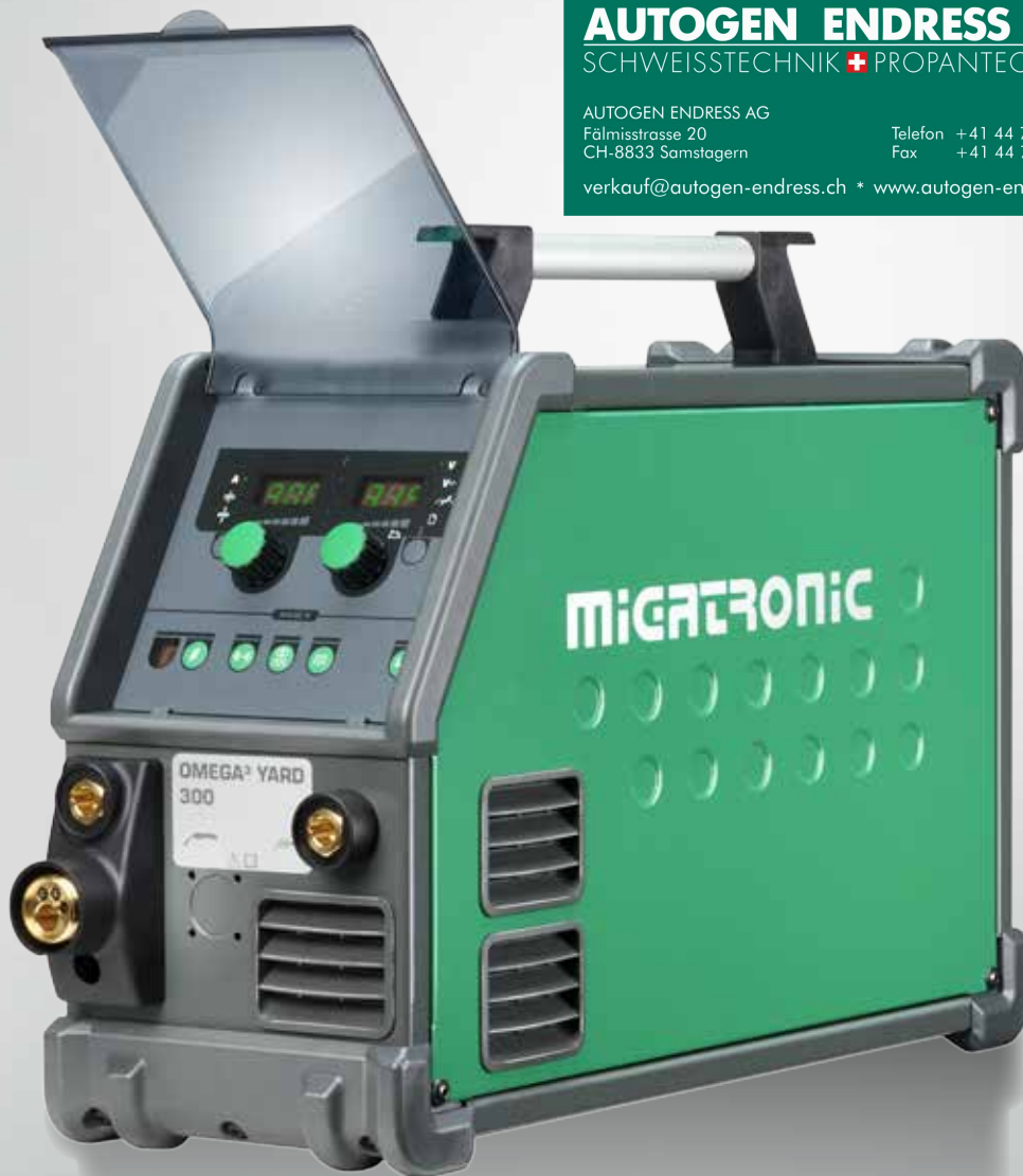
Abb. mit MMA Dinse-Kit (optionale Zusatzausrüstung).

verkauf@autogen-endress.ch * www.autogen-endress.ch