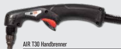
AIR T30 Handbrenner