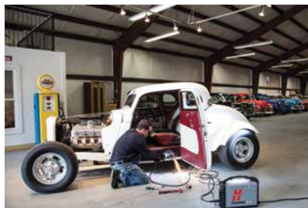
Fahrzeugreparatur und -umbau